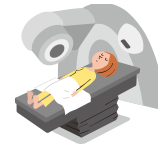
病気で放射線治療を受けたとき