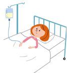
病気で入院したとき、病気で手術したとき 病気で入院後通院したとき